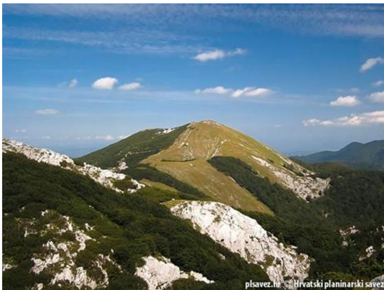
KT HPO Šatorina, 1622 m

Šatorina je, zajedno s jednako visokim Zečjakom, najviši vrh srednjeg Velebita. Ima prepoznatljiv izgled koji privlači pogled iz daljine. Sastoji se od dvije travnate glavice, među kojima je maleni dolac. Prema putopisu Dragutina Hirca, vrh je dobio ime po drvenom šatoru koji su ovdje podignuli geodeti radi mjerenja, ali je ipak vjerojatnije da je ime nastalo zbog oblika brda, nalik šatoru. Put do vrha građen je slično kao i Premužičeva staza, a dio koji se u obliku spirale ovija oko vrha Šatorine lijepo je vidljiv iz smjera nešto nižeg Matijević brijega (1611 m). Šatorina dominira nad dolinom Štirovače, poznatoj po prekrasnim crnogoričnim šumama.