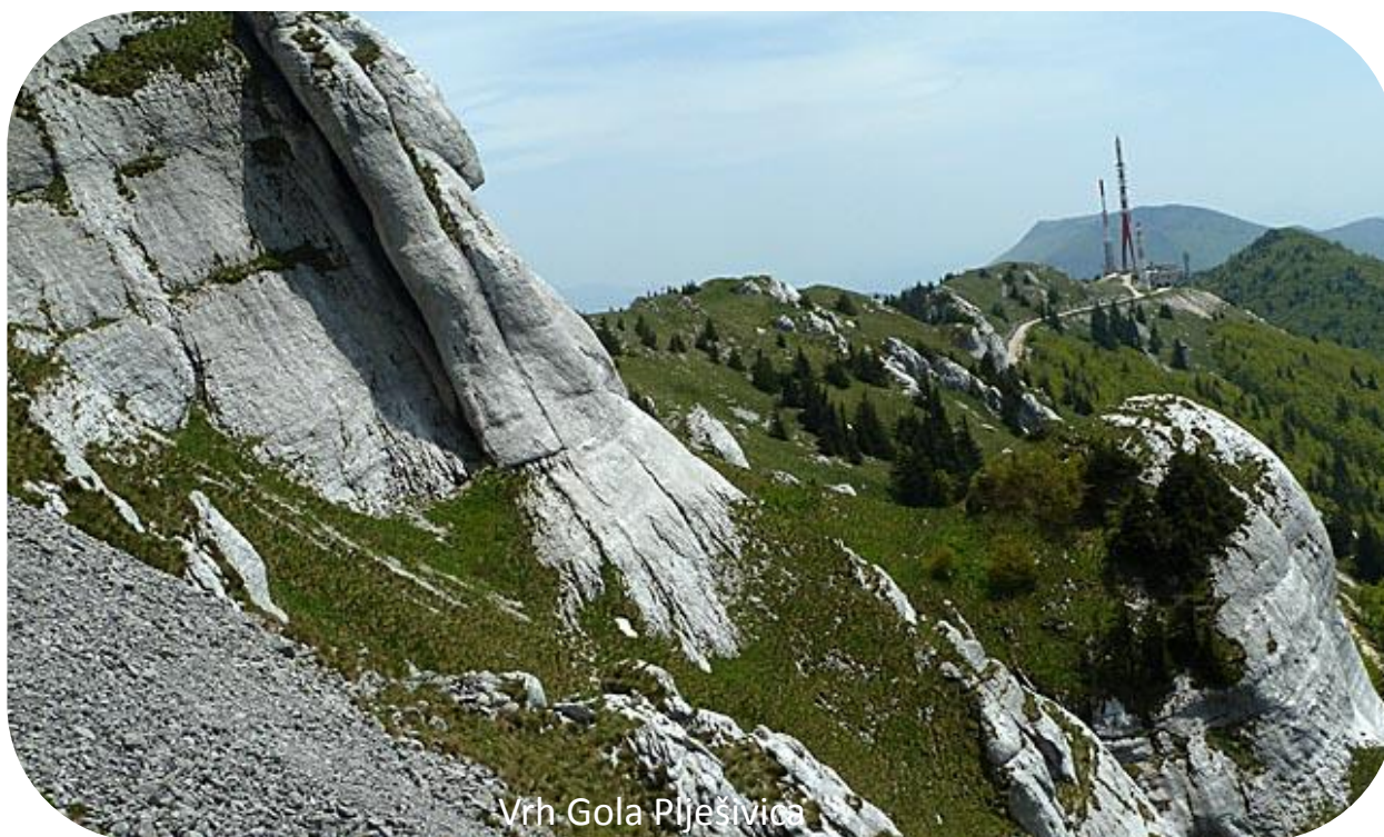
Vrh Gola Plješivica

Lička Plješivica je izduženi planinski masiv – greben čiji se manji dio nalazi na granici sa Bosnom i Hercegovinom kod Bihaća. Pruža se u smjeru sjeverozapad-jugoistok u dužini 100 km od Plitvičkih jezera do izvora Zrmanje i dijeli Liku od Pounja. Istočne strmine Plješivice padaju u duboki kanjon gornje Une, a na zapadnoj strani su Koreničko, Lapačko, Kamensko i Krbavsko polje. Na sjeveroistočnoj bosanskoj padini se spuštaju kamene potočne doline Melinovac, Skočaj i Zavalje, te na ličkom jugozapadu kod Udbine, Kozja draga.