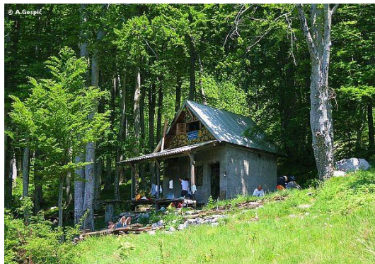
Sklonište Ivine vodice