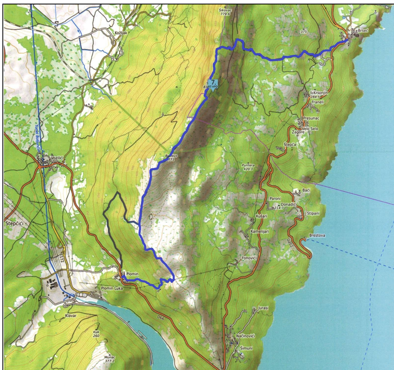
Trasa staze Plomin – Sisol - Brseč