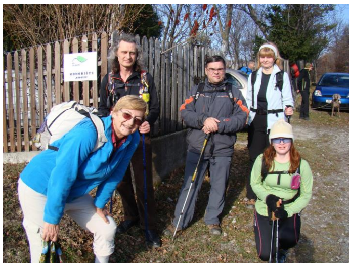
TRASA HORVATOVOG POHODA