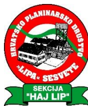
Sekcija društvenih izleta „HAJ LIP“

pozivaju članove društva na zajednički planinarski izlet