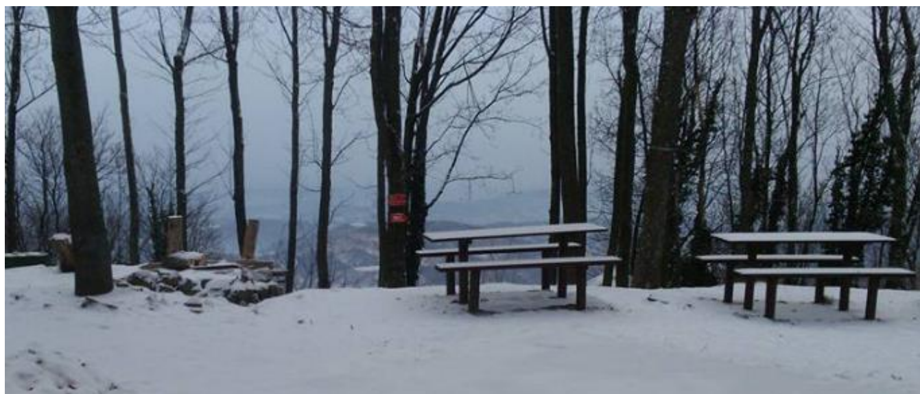
Jučer na Lipi

Jedan od najvažnijih dana u godišnjem rasporedu našeg planinarskog društva je – HORVATOV POHOD. Tradicionalni planinarski pohod od centra Sesveta do našeg planinarskog doma na Lipi, održat će se nadolazeće nedjelje, 15. siječnja 2017. Pogledajte najavni plakat sa svim relevantnim informacijama u nastavku ovog lista.