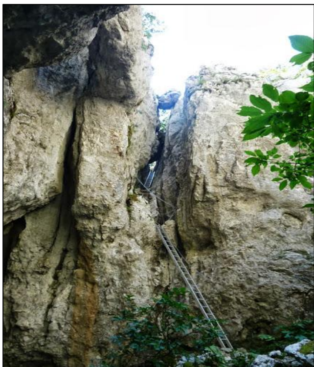
Zdenkova jama (spust stepenicama)