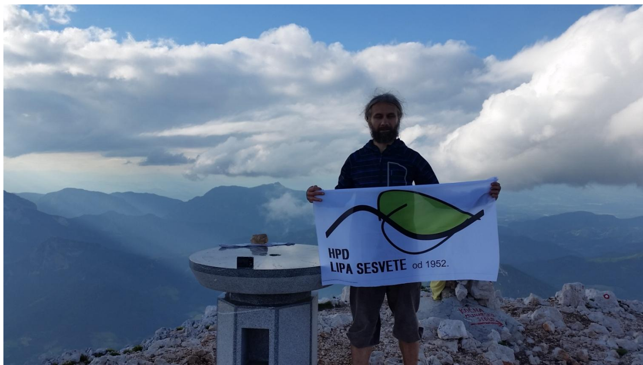
Vodič na Grintovcu

subota i nedjelja, 29. i 30. lipnja 2019.