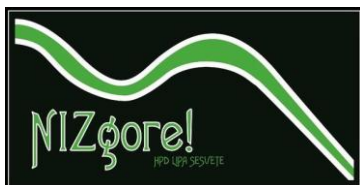
Sekcija NIZgore! up!