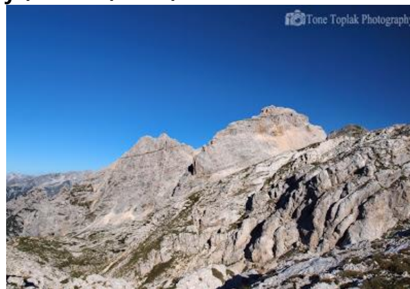
Planja i Razor