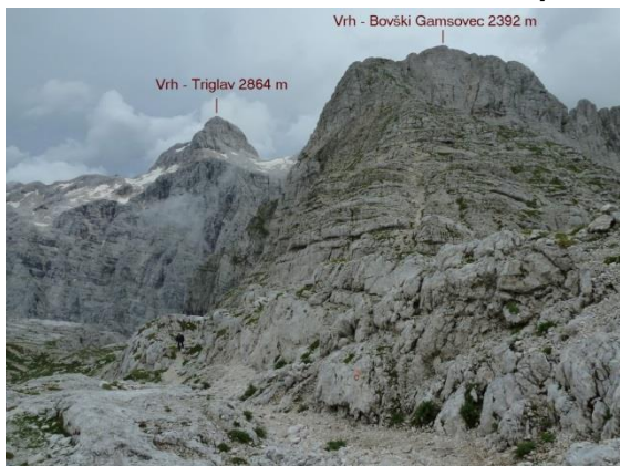
Pogled na Triglav i Bovški Gamsovec iz podnožja Stenara