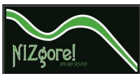
Sekcija NIZgore! up!