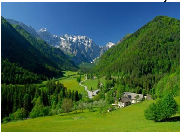
Pogled na Logarsku dolinu

Logarska dolina /Slap Rinka/ Kamniško sedlo 1864mnm/Brana 2252 mnm/ Planjava 2394mnm