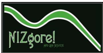
Sekcija NIZgore! UP