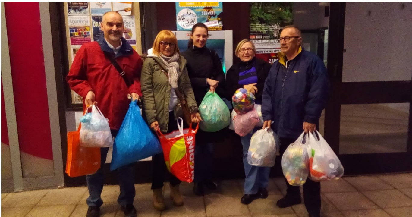
Iznošenje prikupljenih čepova iz prostorija Društva