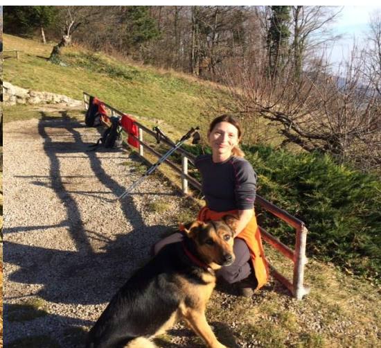
Pl.dom Žitnica na Japetiću

Oštrc je vrh alpskog izgleda u središtu Samoborskoga gorja. Dobro je vidljiv izdaleka i prepoznatljiv je po strmim padinama na obje svoje strane. Vršni dio nije pokriven šumom, a odlikuje se velikim strminama pa se s njega pružaju široki vidici. Na južnoj strani vrha je 15 m visoka stijena Flinka koja služi kao alpinističko vježbalište. Na sedlu pod vrhom je planinarski dom „Željezničar“.