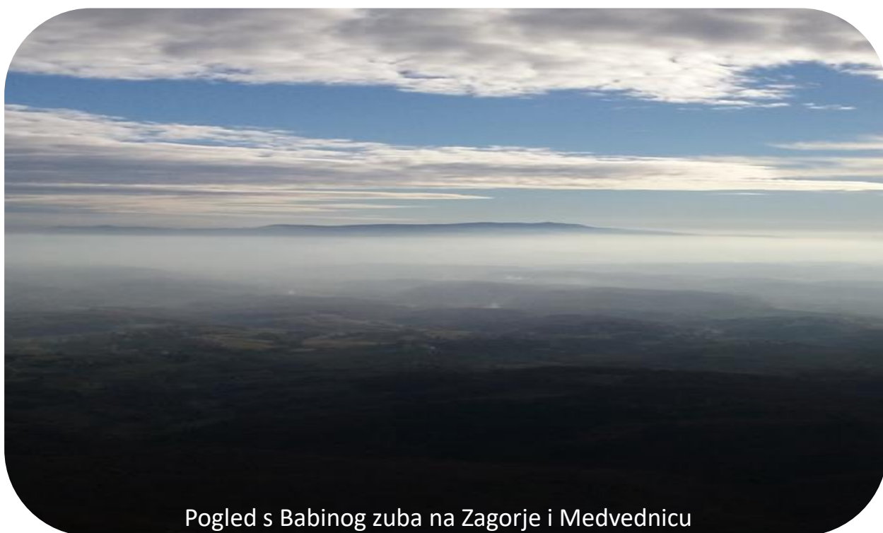
Pogled s Babinog zuba na Zagorje i Medvednicu

Pl. kuća Belecgrad (440 mnv) - vrh Ivanščica (1060 mnv) - Belige (974 mnv) - Babin zub (638 mnv)- Belecgrad (532 mnv)- pl. kuća Belecgrad