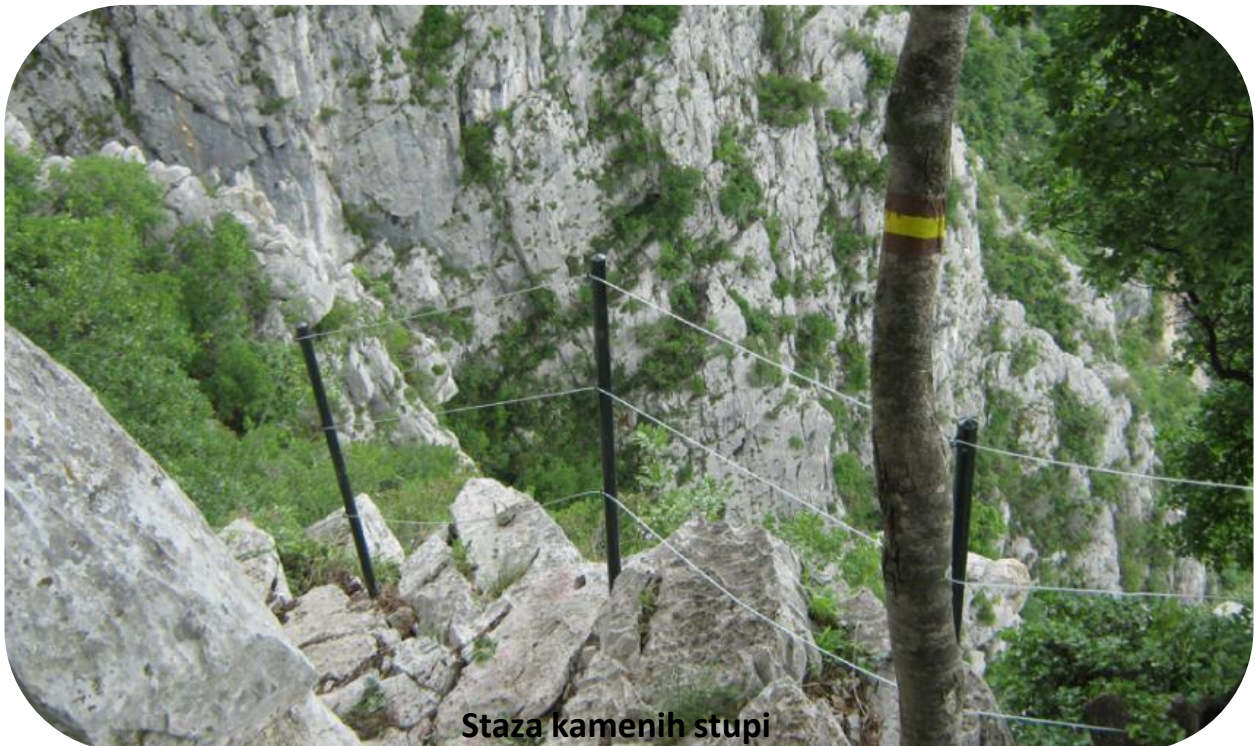
Staza kamenih stupi