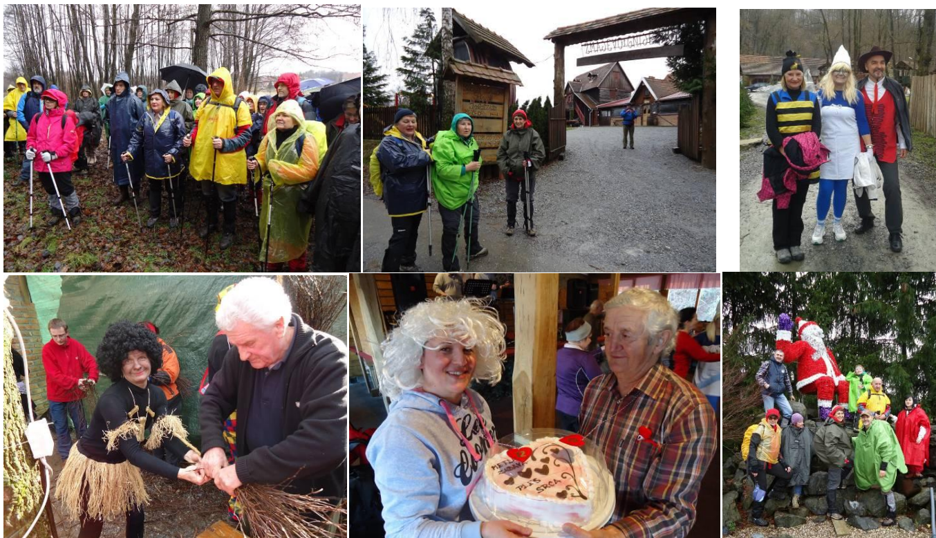
SA ZABAVE 2016.