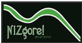
Sekcija NIZgore! up!