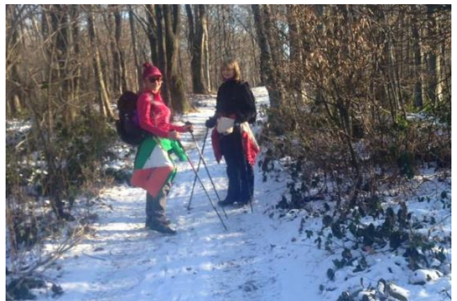
Uspon na Lipu 1. siječnja 2017. godine