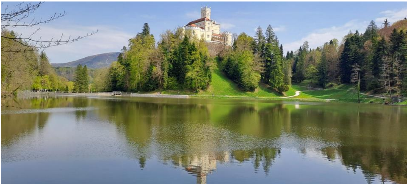
Pripremio: Vladimír Bešták