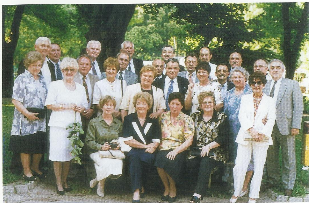
Maturanti gimnazije u Virovitici nakon 40 godina, Virovitica, 1997.

Nekoliko mjeseci kasnije saznala sam da studira stomatologiju. Kasnije je otvorio vlastitu ordinaciju u jednom gradu nedaleko od Zagreba. Mislim da nikada nije saznao zašto sam upisala studij geodezije. On nikada nije došao na proslave naših godišnjica mature, iako se u Virovitici sastajemo svakih pet godina. To su divni i dirljivi susreti.