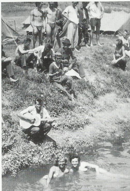
Odmor - kupanje, gitara, šatori, Lozan 1956.

Ipak nam je bilo lijepo na tim radnim akcijama, unatoč tome što nam je jednooki kuhar pod sklepanom nadstrešnicom za doručak pripremao neku crnu tekućinu od Divke ili cikorije (zvali smo je crnački znoj) s komadinom kruha na koju je žlicom bila nabačena neka grozna bijela UNRINA krema koja se kao loj lijepila za nepce. Nešto slično tome sredinom dana donosili su nam i na radilište. Za ručak bi često bio grah, kuhan u kotlu s neobrijanim svinjskim kožicama oderanim s crnih svinja. Zvali smo to: grah s ježevima jer su kožice, onako kuhane, ufrkane i naježene, zaista izgledale kao morski ježevi. Večera se sastojala od kukuruznih žganaca, makarona ili nekih sličnih delicija . Zahvalu tom kuharu, iako sigurno nije bilo posve pristojno, iskazivali smo uz pratnju gitara kraj logorske vatre, pjevajući: "Za tvoje plavo oko sve bih dao ja ....". Uistinu je imao plavo oko.