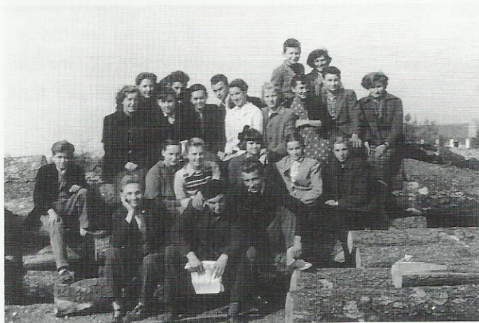
“Vlakaši”, čekajući vlak, “Mala stanica”, Virovitica, 1954.

razred gimnazije u Virovitici. U školu sam iz Suhopolja vlakom putovala pet godina. Mi, vlakaši, bili smo nekako posebni; krivi za sve počinjene nepodopštine; za razbijene prozore i za loptom razbijenu Titovu sliku u gimnastičkoj dvorani uoči proslave Dana Republike. Putovali smo vlakovima iz smjera Slatine, Pakraca i Đurđevca. Među nama je vladala određena solidarnost i prijateljstvo. U školu smo dolazili skupno, prema redu vožnje vlakova, katkad dosta ranije, a katkad smo i kasnili na satove kad bi zimi, zbog visokoga snijega, vlakovi stizali sa zakašnjenjem. Škola nam je bila neka vrsta utočišta poslije nastave, osobito zimi i za kišna vremena. Zadaće smo katkad pisali i prepisivali ujutro u vlaku ili u razredu prije početka sata. Zapravo nas nekoliko nije ni smjelo doći na vlak bez gotovih zadaća.