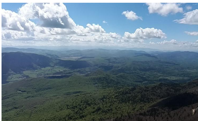
Pogled na Liku.