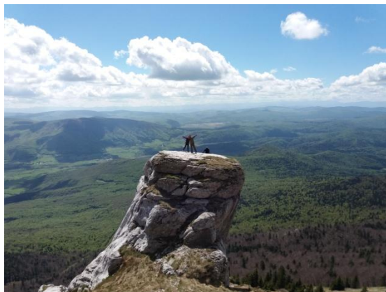
Stijena Lička kapa.