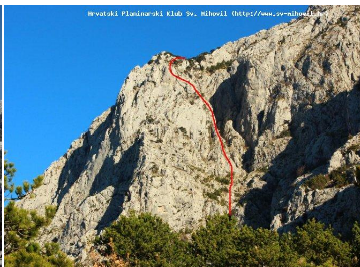
Mali Šibenik 1388 m

Sv. Jure je najviši vrh Biokova i drugi po visini u Republici Hrvatskoj. To je kamenit vrh s malom zaravni na kojem je u ograđenom prostoru velika zgrada televizijskog i telekomunikacijskog odašiljača. Sama vršna točka, označena geodetskim stupom, nalazi se u ograđenom prostoru i nije dostupna planinarima. Izvan ograde nalazi se slikovita kapela sv. Jure.