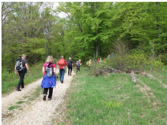
Uspon prema vrhovima Mala i Gola Plješivica.