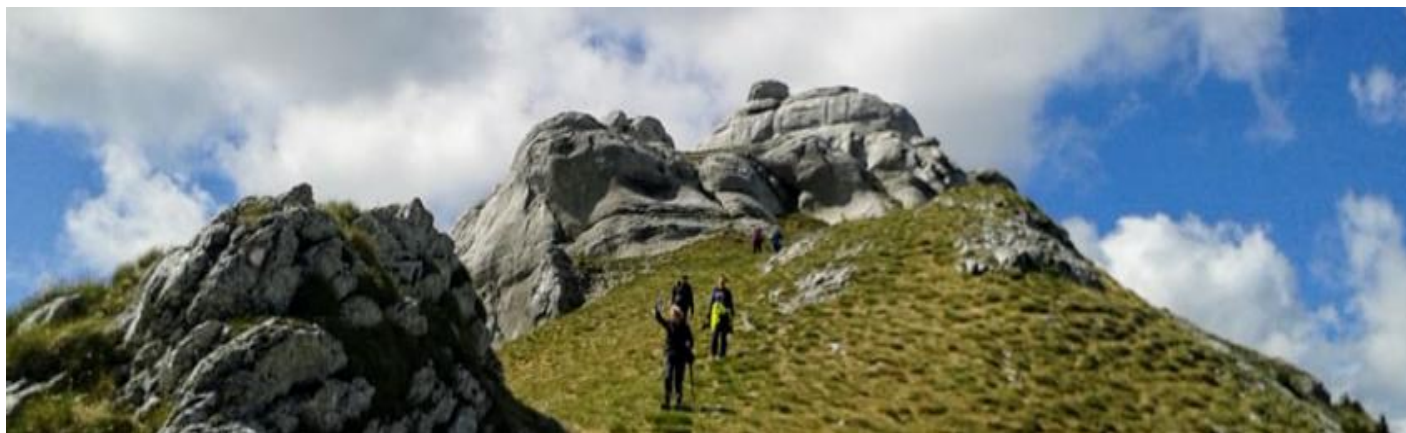
s Ličke Plješivice

Jedna od mogućnosti je da uplatite članarinu te pozovete prijatelje i rodbinu da se učlane u Lipu!