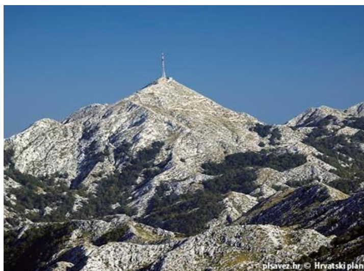
Vrh Sv. Jure, KT HPO, 1762 m,