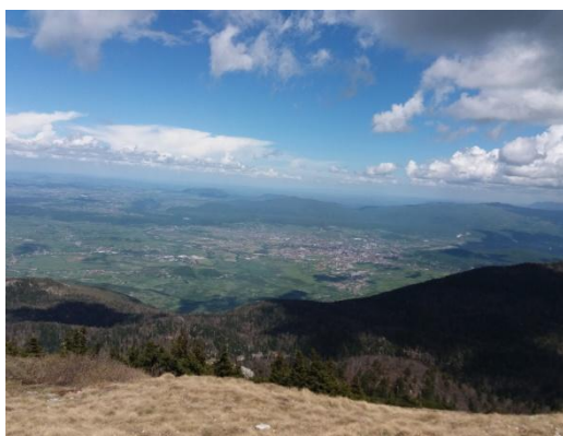
Pogled prema Bihaću.