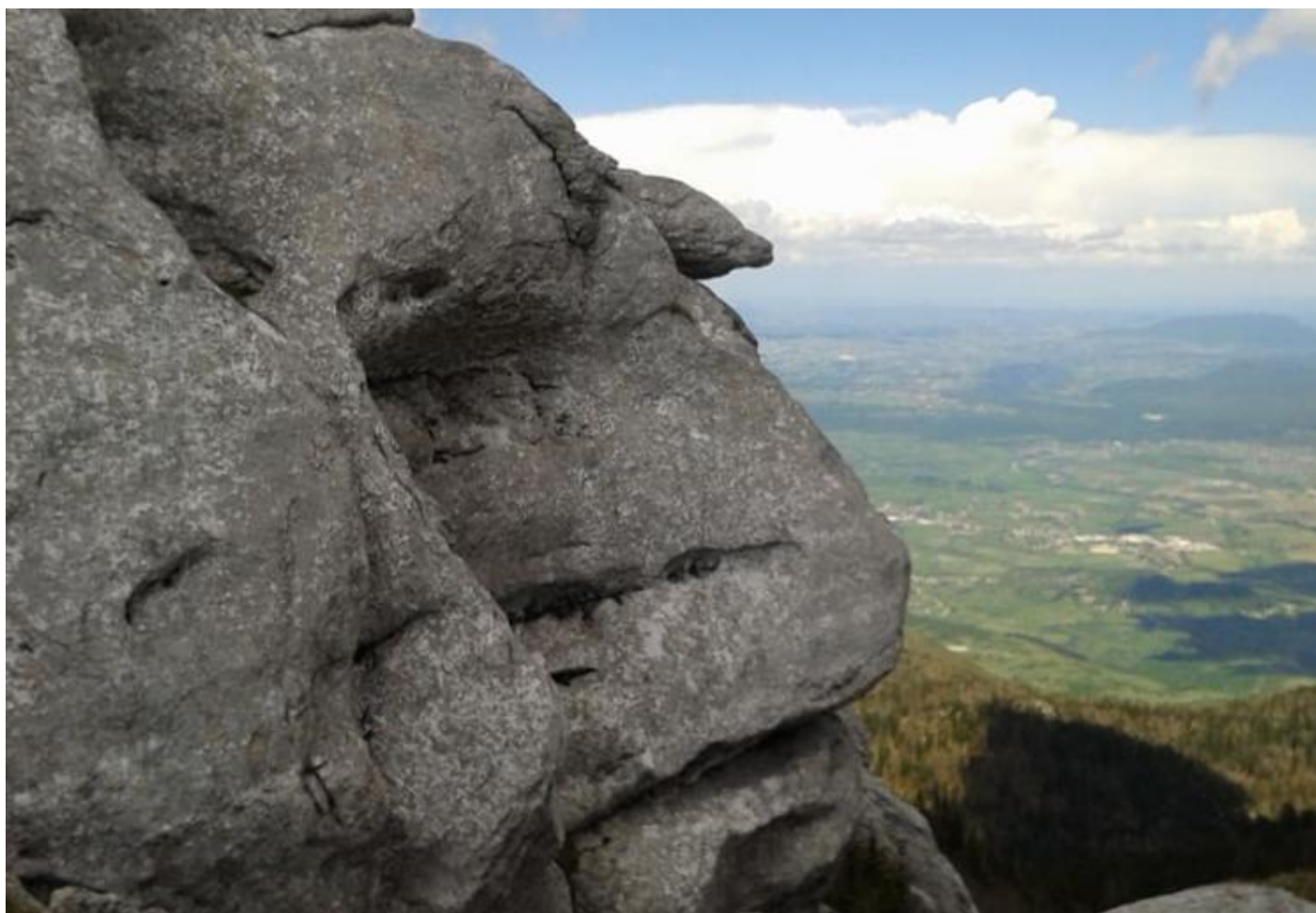
s Ličke Plješivice