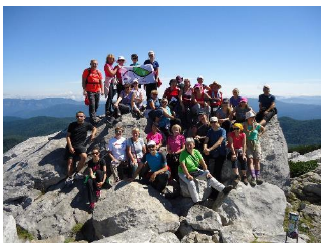
„Lipaši“ na Risnjaku, 2016.