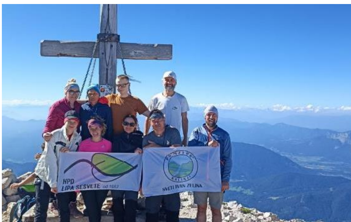
Na Mangartu 2023.