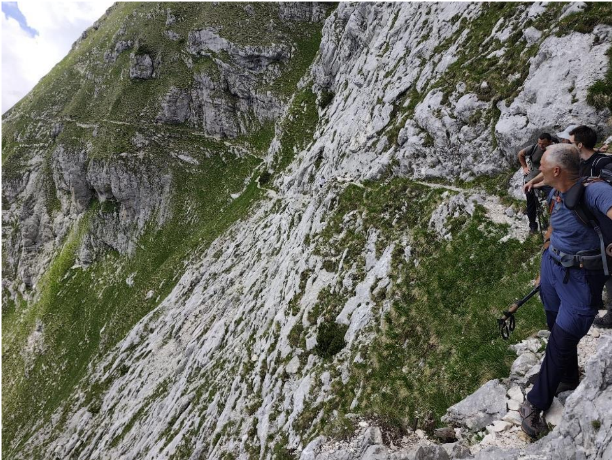
Usječena staza ispod Malog Draškog vrha