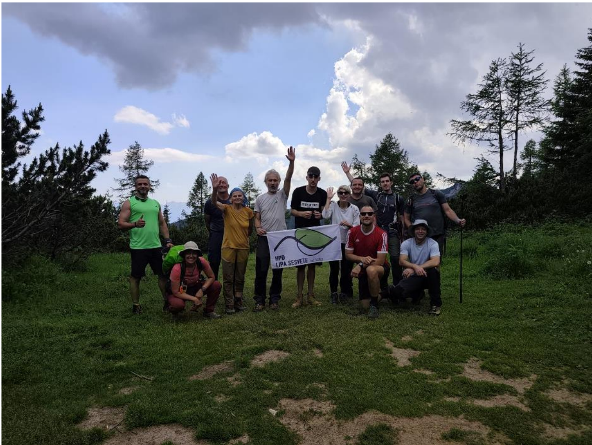
Vidimo se na idućem izletu!