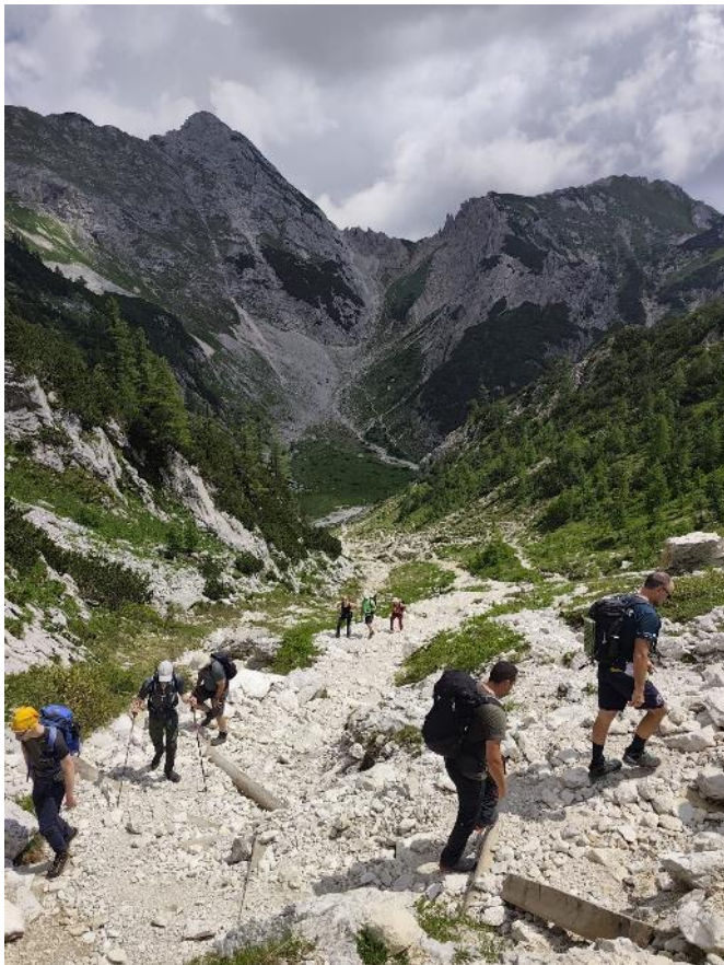
Pogled unazad na Veliki Draški vrh