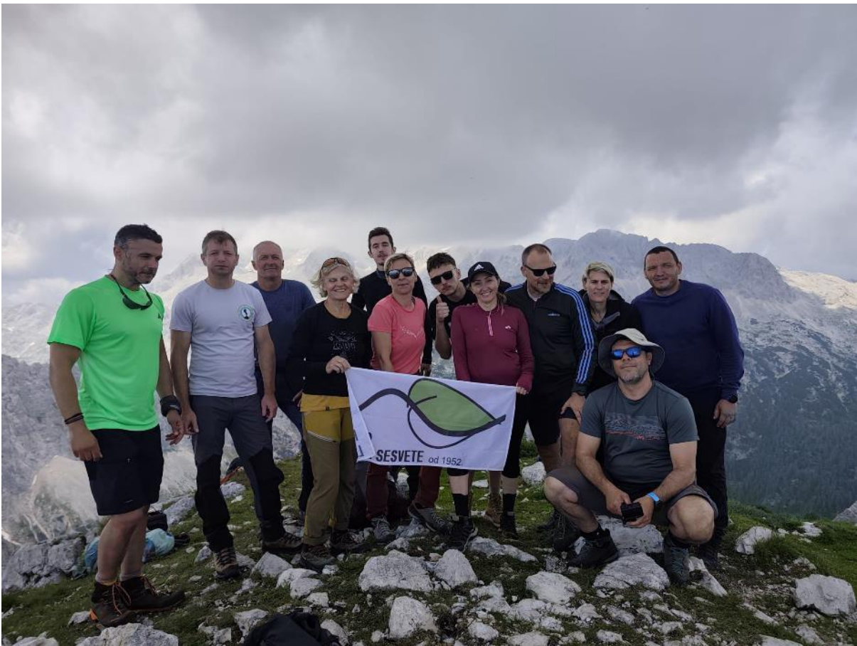
Veliki Draški vrh