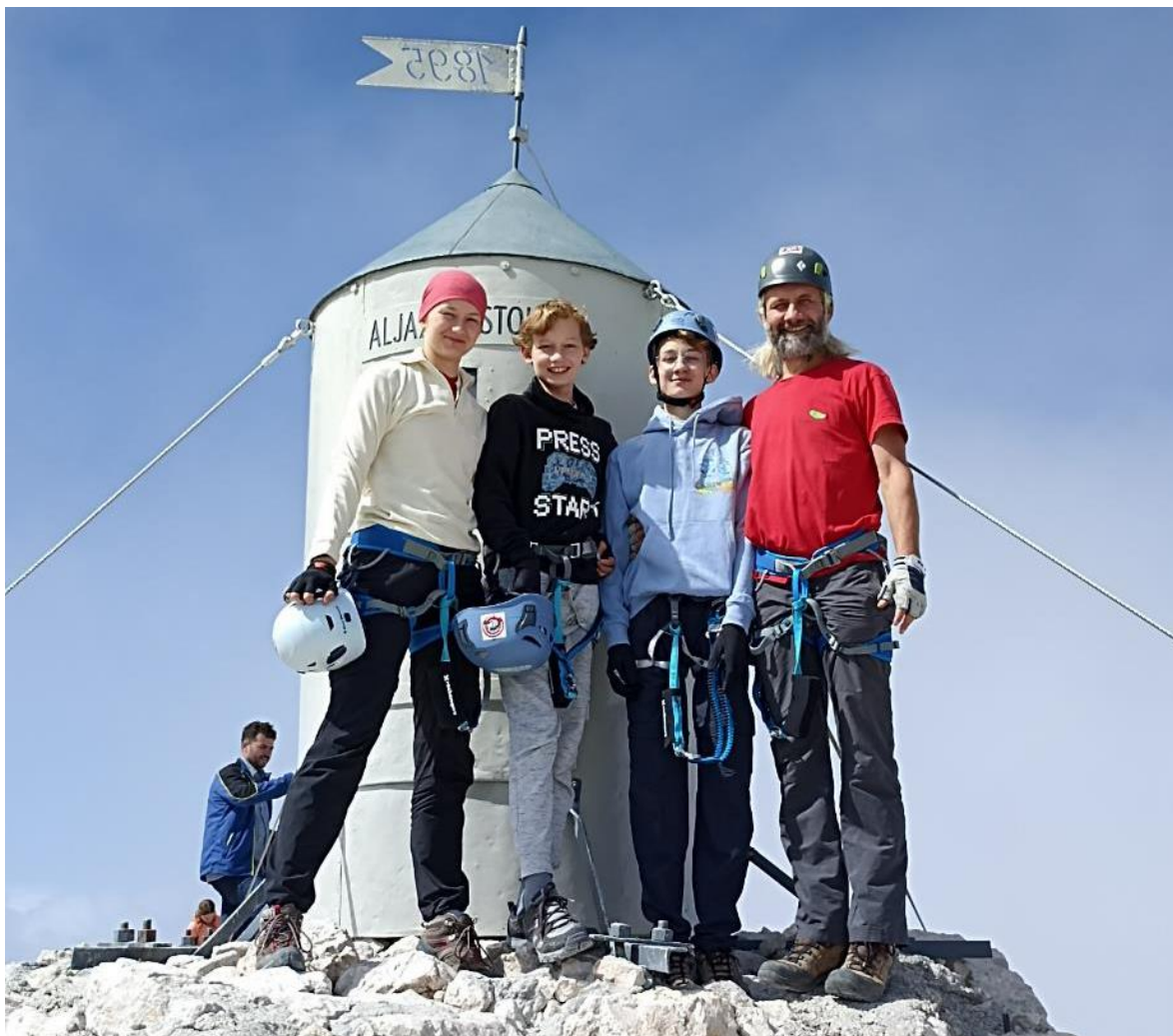
Mladi članovi Lipe na Triglavu

Cilj ovog izleta je popeti se na najviši vrh Slovenije kružnom stazom te odvojiti vrijeme za uživanje u ljepoti Julijskih Alpa, uz minimalno potreban trud.