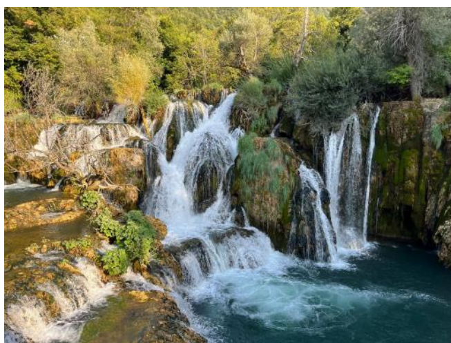
Opisao: Vladimir Beštak