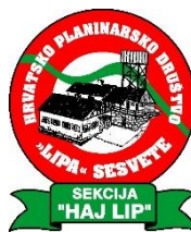
Sekcija društvenih izleta „HAJ LIP“

pozivaju članove društva na zajednički planinarski izlet