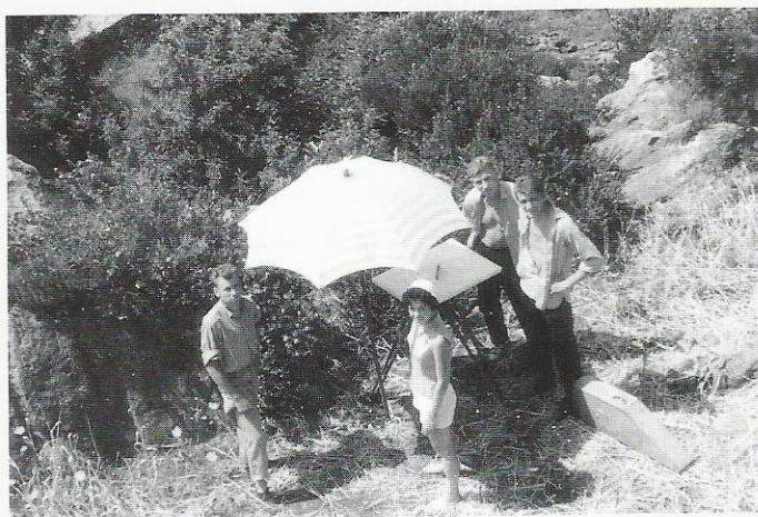
Isto - u zaraštenom i visinski razvedenom terenu

Snimali smo blizu mora, a kad bi nam mozak uzavreo od vrućine, osvježili bismo se u moru i sve je teklo dalje. Profesor Krajziger bio je baš duša od čovjeka. Neumorno je obilazio sve terenske grupe i svemu nas poučavao. Poslije podne, još za danjeg svjetla, prema dobivenim podacima o visinama snimljenih točaka, iscrtavali smo preko snimljenog detalja slojnice iz kojih se mogla vidjeti visinska razvedenost terena.