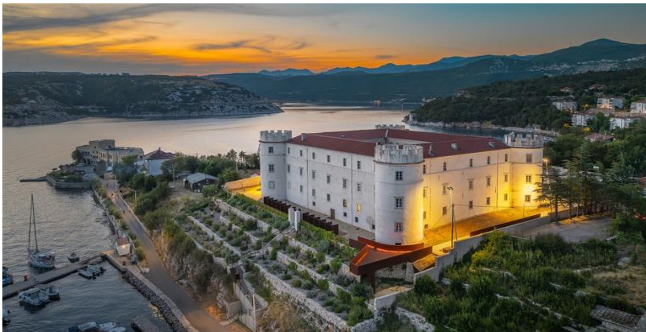
Dvorac Nova Kraljevica - Frankopan