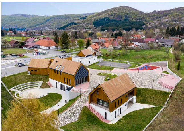
POSJETITELJSKI CENTAR SOŠICE