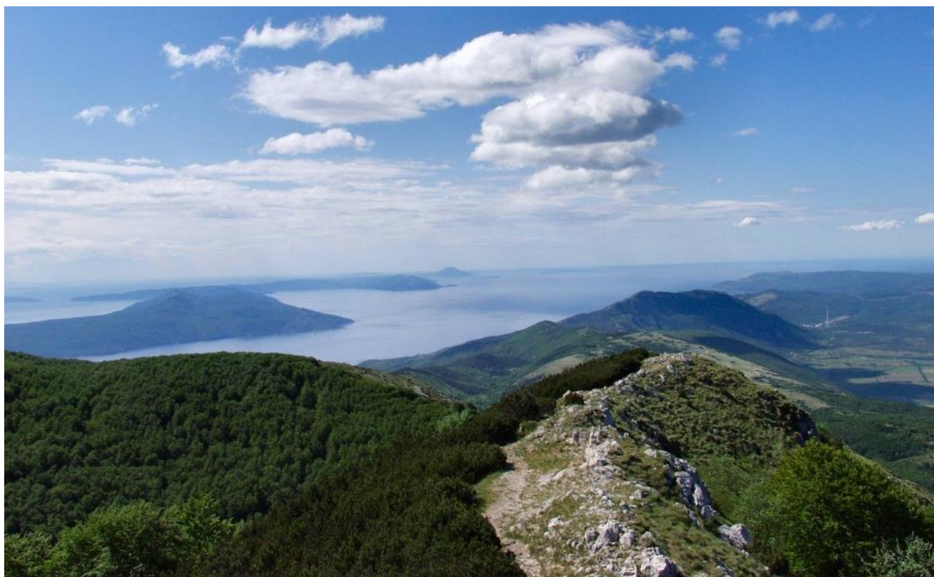
Pogled s Vojaka