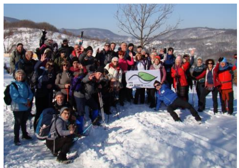
S prošlogodišnjeg Vincekova u Kašinskoj S opnici